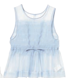
DRESS¥15,400 BY RAY BEAMS