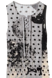
TANK TOP¥28,600 BY P.A.M. * RAY BEAMS