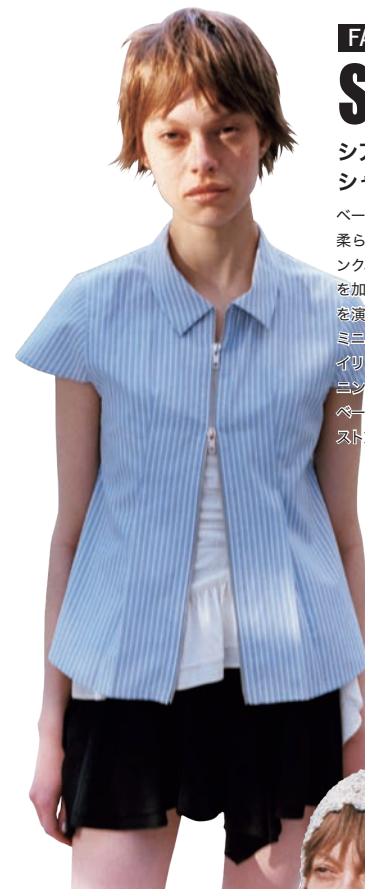
SHIRT¥12,100 CAMISOLE¥11,000 SKIRT¥13,200 ALL BY RAY BEAMS

フリルディテールが、今季はより大胆で力強い存在へ。繊細な素材感に構築的なフォルムを加えることで、ロマンティックな甘さを超えたモードな印象を演出。ブラックやニュアンスカラーで取り入れることで、華やかさと洗練を両立。フリルは可愛いだけでなく、自分らしい強さを表現する新たなキーワード。