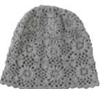
BEANIE¥5,500 BY RAY BEAMS