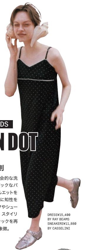
DRESS¥15,400 BY RAY BEAMS SNEAKERS¥11,800 BY CASSELLINI