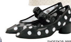
SHOES¥20,900 BY RAY BEAMS

レトロなドット柄が、今季は都会的な洗練をまとって進化。ノスタルジックなパターンに透け感やシャープなシルエットを掛け合わせることで、甘さの中に知性を感じさせるバランスに。スカーフやシューズなど小物で取り入れることで、スタイリングに遊び心をプラス。クラシックを再解釈した、新時代フェミニンの象徴。