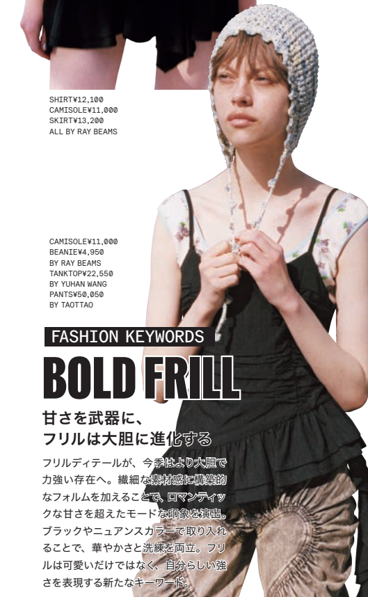
CAMISOLE¥11,000 BEANIE¥4,950 BY RAY BEAMS TANKTOP¥22,550 BY YUHAN WANG PANTS¥50,050 BY TAOTTAO