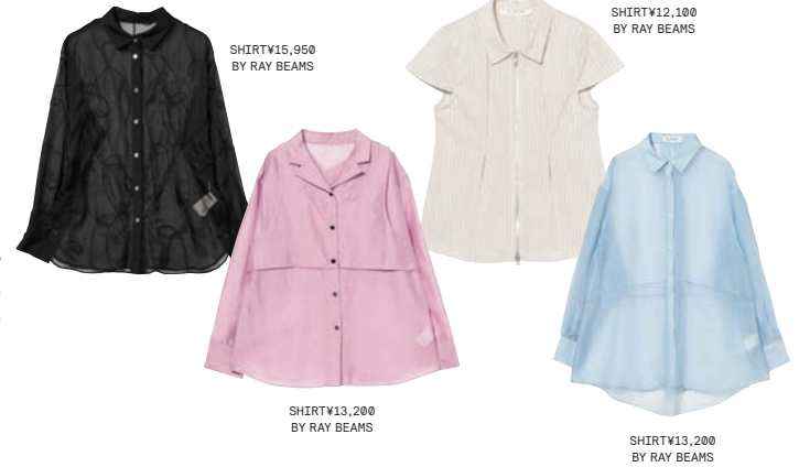
SHIRT¥15,950 BY RAY BEAMS

ベーシックなシャツが、シアー素材や柔らかなカラーで刷新。ブルーやピンク、ストライプの爽やかさに透け感を加えることで、端正さの中に抜け感を演出する。オンにもオフにも馴染むミニマルなシルエットは、幅広いスタイリングに対応。クラシックとフェミニンを軽やかに融合する、新時代のベーシックが、モダンロマンスにはマストアイテム。